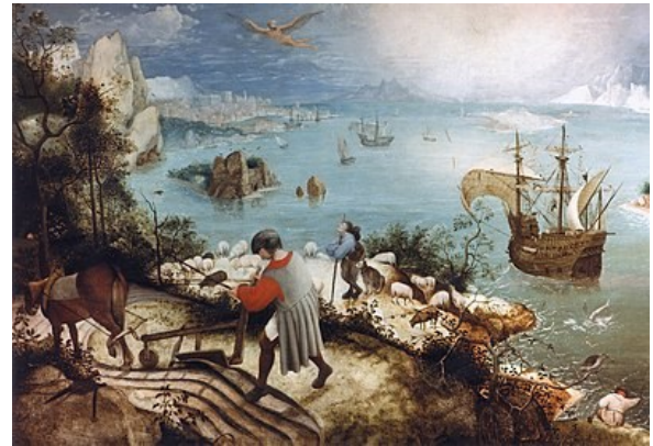
De val van Ikarus nl.wikipedia.org

talliseren. Op het moment dat we een bepaald gedragspatroon, of manier van reageren, denken te hebben overwonnen, drukt er iemand op die oude knop, wordt die modder plotseling weer losgewoeld en kunnen we niet meer helder waarnemen. Alleen als de conditionering verdwenen is, verliest die knop zijn invloed. Als wij niet beseffen dat we geconditioneerd zijn, of geen begrip hebben van onze manier van waarnemen, kunnen we niet hopen veel te bereiken.