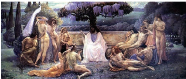
Jean Delville - De School van Plato

Loge Witte Lotus is op dit ogenblik de jongste loot uit de Belgisch Theosofische familie. Opgericht in 2006, beoogt deze Loge eveneens een aantrekkingspool te zijn voor zoekers naar en onderzoekers van waarheid.