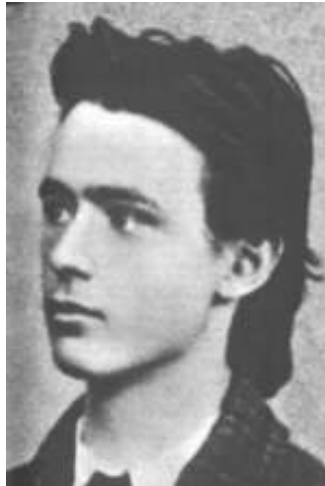
Rudolf Steiner ten tijde van zijn lidmaatschap van de TV http://www.anthroposophie.net/steiner/bib_steiner_zeitafel.htm

Hij zag aanvankelijk de Theosofische Vereniging als een platform, van waaruit hij zijn persoonlijke onderzoekingen en ideeën aan de wereld zou kunnen doorgeven.