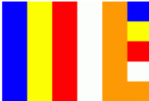
De internationale Boeddhistische Vlag

en de lippen van de Boeddha. Het symboliseert de onaantastbare Wijsheid van de Leringen van de Boeddha.