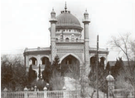
Het Bahá'í Huis van Aanbedding in Ashkabad, Centraal Azië, in 1962 gesloopt.

Het lijkt dus nog niet gepast en aanvaardbaar dit in een eerder stadium te doen.