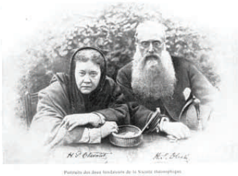
H.P. Blavatsky en H.S. Olcott

Het woord theosofie, dat in de naam van de vereniging staat, werd door de oprichters niet als zodanig gedefinieerd.