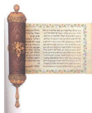
Megilla - rol van Ester

Poeriem is de viering van het 'happy end' van de gebeurtenissen waarover in het Bijbelboek Ester wordt verteld. Het feest dankt zijn naam aan een cruciaal moment in het verhaal van het joodse meisje Hadassa, bekend geworden als Ester.