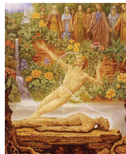
Johfra - De overgang (1989)

http://www.bosshaerts.be/genealogy/histories/07nl_schilders-9_boschart-johfra.php