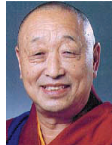
Lungtok Tenpa'i Nyima

In 913 werden de eerste teksten, begraven in het klooster van Samye ontdekt. Een eeuw later zou, door het afbrokkelen van de aarden muren, het merendeel van de verborgen teksten ontdekt worden door de Bön meester Shenchen Luga (996-1035).