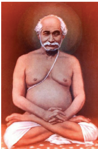
Lahiri Mahasayana http://lahirimahasaya.in/

problemen. Stop ermee een slachtoffer te zijn van je lichaam; leer te ontsnappen in de Geest, door de geheime sleutel van Kriya.”