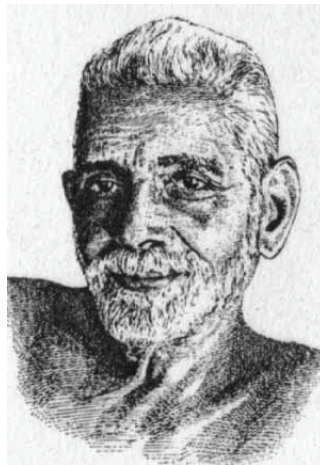
Sri Ramana Maharshi

del voorgesteld. Dergelijke auditieve of visuele beoefeningen kunnen zeer valabel zijn bij het komen tot de juiste concentratie, echter, eens de juiste concentratie bereikt, worden ze achtergelaten als een nuttig gereedschap dat zijn dienst succesvol heeft volbracht en dat niet verder van nut kan zijn.