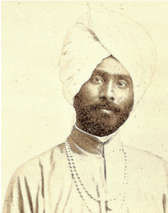
Hazrat Inayat Khan

Inayat Khan, de grote Soefimeester uit India is de vader van het moderne universeel soefisme, dat de waarde van alle religies op de weg naar het Goddelijke erkent.