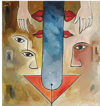
Purusha en Prakriti

bieden van het fysieke plan, zijnde eerste ether, tweede ether, atomair en subatomair, kunnen we vooralsnog niet waarnemen met onze zintuigen (3). Door middel van een sterk en strikt getraind en gerealiseerd bewust-