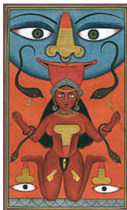
Purusha en Prakriti

Een subatomair deeltje kan men zich voorstellen als een infinitesimaal klein bolletje dat roteert om zijn eigen as en deze rotatie wordt de “spin” van dat