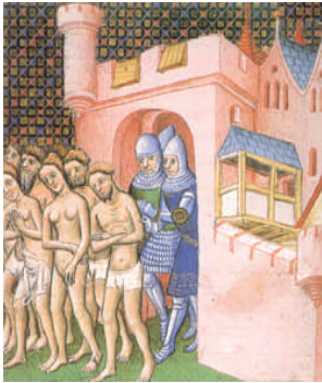
Verdrijving van de katharen uit de Zuid-Franse stad Carcassonne.

Er werd in het verleden reeds veel geschreven over deze beweging die zich manifesteerde in West-Europa vanaf de 11 tot de 14 e eeuw.