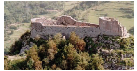
Ruïnes van Montségur

In het tweede deel wordt nagegaan hoe foutieve gedachten in de geschiedschrijving binnengeslopen zijn en een eigenleven zijn gaan leiden. B.v. de burch van Montségur, die er nu staat,