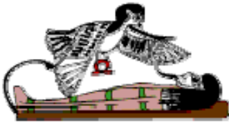
De ziel of BA

menselijke lichaam te scheiden. De KHAIBIT was vrij zich te bewegen waar het maar wou. Zoals de KA en de BA nam het ook een deel van de begrafenis-offergaven in het graf.