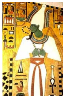
Osiris - God van de onderwereld http://www.pagefarm.net/wiki/images/1/15/Osiris3big.jpg

Het conserveren van het fysieke lichaam was, in zekere zin, verbonden met het toekomstige leven in een andere wereld en de bewaring ervan was