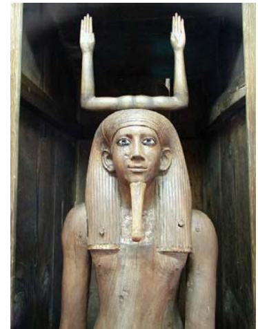
Het dubbel of KA templeofstarlight.eu/.../image/ka-statue.jpg

gevoed werd, vergankelijk. In de piramideteksten is de permanente woonplaats van de BA, of ziel, de hemel met de goden, wiens leven het deelde.