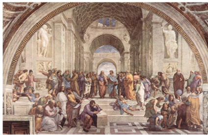
De Atheense school van Rafaël Santi, waarop tal van Griekse filosofen staan afgebeeld.

ringen die, door middel van mythen, van geslacht op geslacht, werden doorverteld. In een mythe, of we kunnen ook zeggen, een verhaal over goden, werd op begrijpelijke wijze uitleg gegeven waarom het leven is zoals het is.