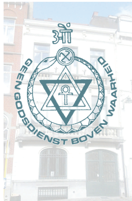
Geuzenplein 8

werkjes, grondige meditatie over de betekenis van hun leringen en vooral het in de praktijk brengen ervan, kunnen de idealistische mens dichter bij de Grote Meesters van Wijsheid en Mededogen brengen, de spirituele gidsen van de mensheid. Alle theosofische literatuur werkt in dezelfde richting.