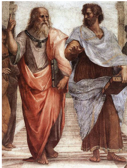
Vlnr Plato en Aristoteles Rafaël Santi (Stanza delle Segnatura, Rome http://nl.wikipedia.org

lopen het gevaar van verwarring of misleiding als we ons niet realiseren dat al onze daden gebaseerd zijn op de een of andere metafysica en als we niet weten welke metafysica we gebruiken in onze omgang met de wereld. Metafysica negeren is het meest onpraktische en dwaze wat we kunnen doen.