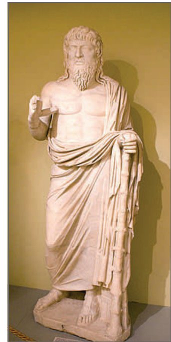
Apollonius van Tyane fr.wikipedia.org

gewone mens, zullen ze slachtoffer worden van vervolging en inquisitie. Maar de heilige vaten zullen niet ontheiligd worden; ze zijn gemaakt voor de Koninklijke tafels; dit wil zeggen voor de banketten van de intelligentie. Door het onderscheidingsvermogen van de geesten zullen ze zich kunnen vrijwaren van het voorrecht der groten en onoverwinnelijk worden in hun kracht en hun vrijheid.