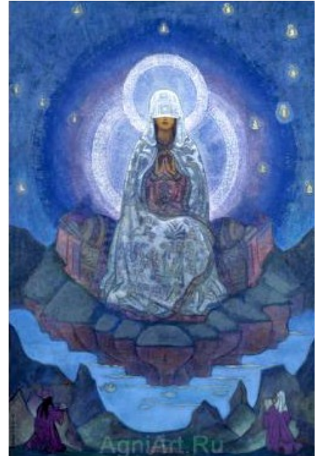
Mother of the World Nicolas Roerich http://www.agniart.ru

haar zorg die ze alle levensvormen ter beschikking stelt.