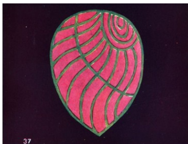
Sympathie en Liefde voor alles http://www.anandgholap.net/Thought_Forms-AB_CWL.htm