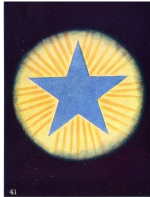
De Logos zoals gemanifesteerd in de mens http://www.anandgholap.net/Thought_Forms-AB_CWL.htm

blinde massa met zijn chaotische emoties.