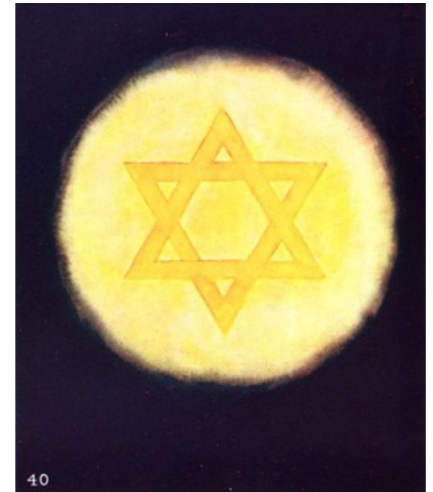
Intellectueel concept van de Kosmische Orde http://www.anandgholap.net/Thought_Forms-AB_CWL.htm

Dit was, in het kort, een manier om bewust met de egregoor van je groep samen te werken. Toch mag men de kracht niet onderschatten van groepen mensen die samen liederen zingen of slogans scanderen uit sympathie voor de organisatie waartoe ze behoren. Zelfs al zijn ze hier niet van bewust.