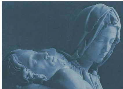
Pieta. Michelangelo, 1499. Vaticaan, St. Pietersbasiliek. http://www.zwartzusters-bethel-brugge.be/charisma2.html

hetzelfde onderliggend leven, van één en dezelfde grote levensstroom. Alle wezens zijn onderling afhankelijk en solidair: de gehele mensheid, de dieren en de planten, tot aan het mineralenrijk. Dit feit wordt aangetoond door de natuurwetenschappen, de astronomie alsook de menswetenschappen – en in de eerste plaats de ecologie, en vooral door de Theosofie. De vervolmaking van de mensheid verloopt parallel aan de vervolmaking van de natuur.